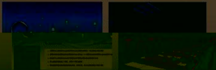
图 5-1-1 软件界面